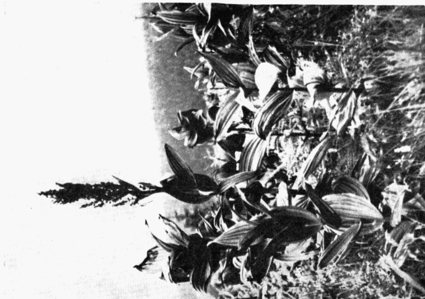
Obr. 2. Veratrum album L. subsp. lobelianum (BERNH.) RCHB., charakteristický habitus kvetoucích rostlin. Krkonoše, Labská louka, 1. 8. 1965. Veratrum album L. subsp. lobelianum (BERNH.) RCHB., blühende Pflanzen. Riesengebirge, Elbewiese, 1. 8. 1965.