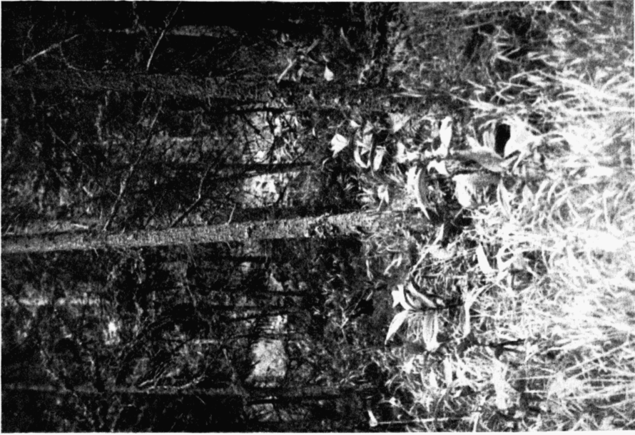
Obr. 4. Typická lokalita Veratrum album L. subsp. album L., v rašelinné smrččině. Novohradské hory, Pohří na Sumavě, 10. 9. 1965. — Der typische Standort von Veratrum album L. subsp. album L., im Moorflechtenwalde, Gratzener-Gebirge, Buchers, 10. 9. 1965