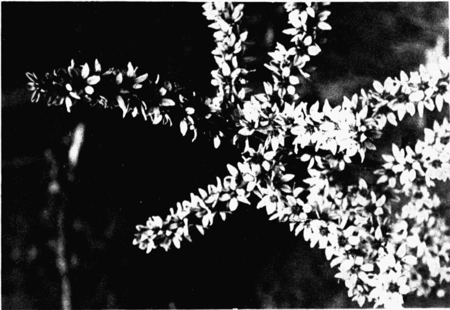
Obr. 3. Veratrum album L. subsp. album L., část květenství Veratrum album L. subsp. album L., ein Teil des Blütenstandes